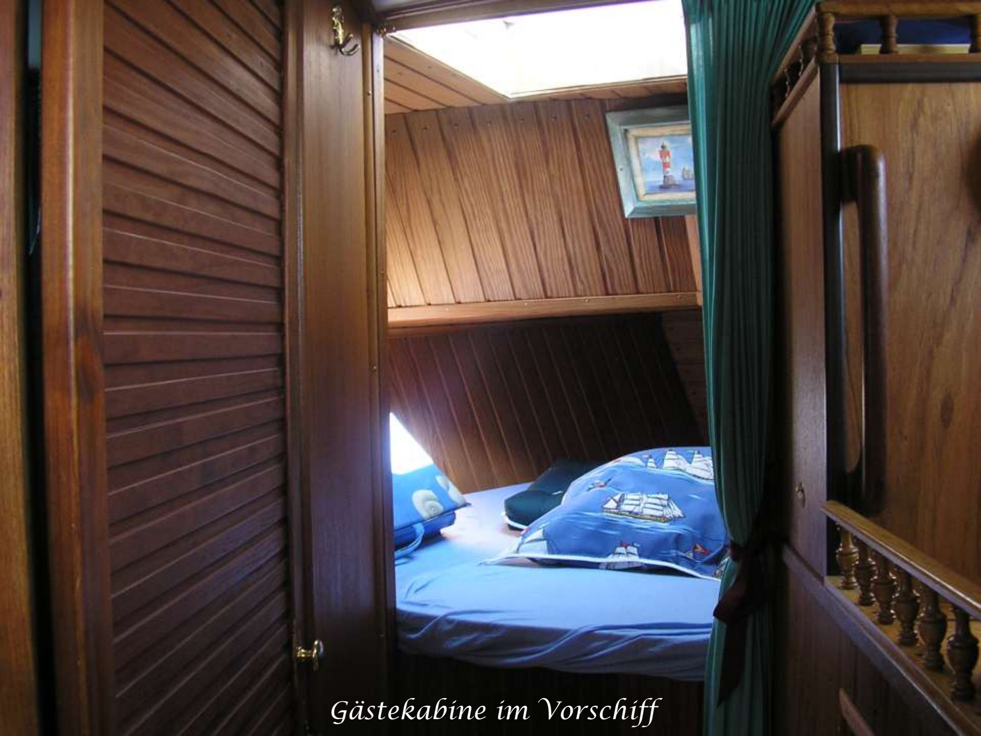
Gästekabine im Vorschiff